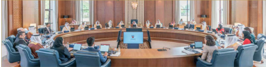
سمو ولي العهد يرأس مجلس الوزراء برأس الاجتماع السنوي لمجلس الوزراء