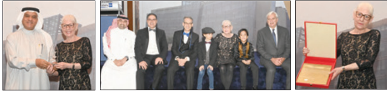
تصوير - عبدعلي قريان